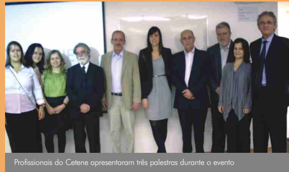
Profissionais do Cetene apresentaram três palestras durante o evento

Dando continuidade ao projeto de parceria com profissionais de renome no setor de saúde e empresas prestadoras de serviços desta área, a Superintendência de São Paulo promoveu mais um Café da Manhã, no último dia 21 de setembro, no auditório da UNIDAS Nacional.